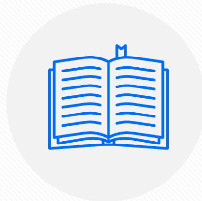
Концепция государственной поддержки и продвижения русского языка за рубежом