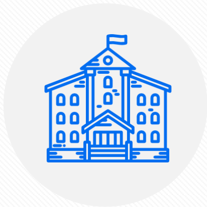
Концепция «Русская школа за рубежом»